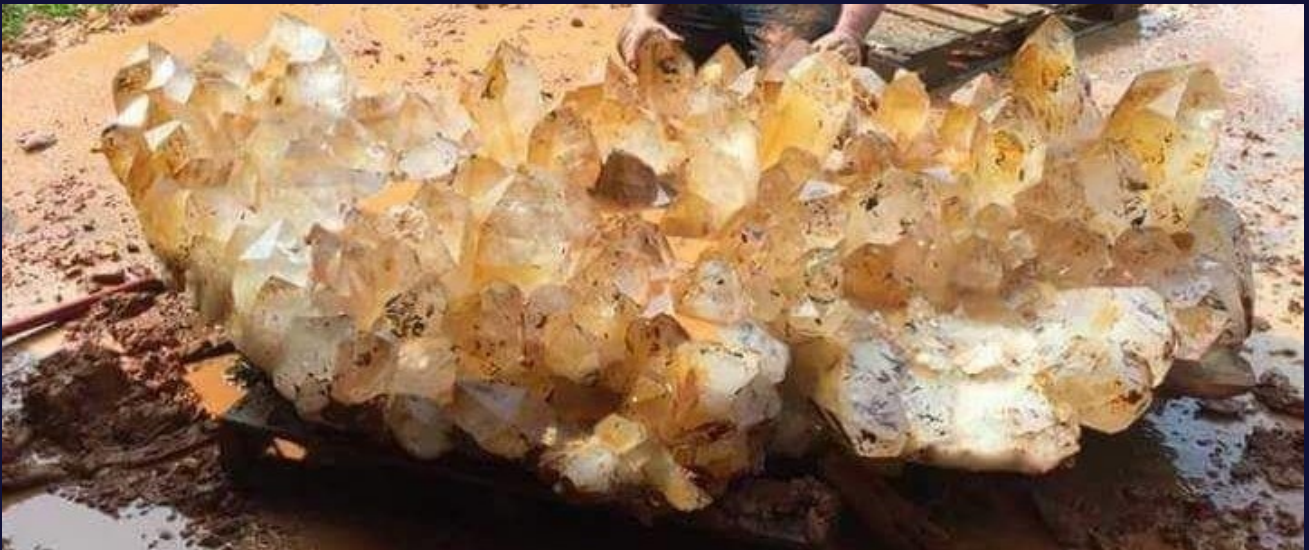
Amas cristallin géant trouvé en Arkansas

Les énergies cristallines émanent des cristaux présents sur la Terre. Cela concerne particulièrement les cristaux de roche appelés Lémuriens ou Atlantes qui ont été encodés d'informations dédiées à nous souvenir de qui nous sommes en cette incarnation. Ces cristaux créent un réseau énergétique permettant de nous libérer de nos conditionnements actuels et de nous éveiller à notre véritable nature. Leur structure physique et énergétique parfaite est en harmonie avec la géométrie sacrée. Ainsi, ces énergies réharmonisent l'aura et permettent d'élever considérablement nos vibrations, de façon douce et profonde à la fois.